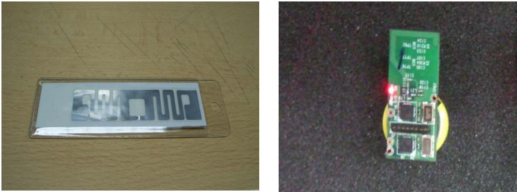
<그림 2> 실험에 사용된 수동형 태그(좌)와 능동형 태그(우)

실험결과 수동형 태그는 RFID 리더와의 거리와 리더와 이루는 각도에 따라서 수신율에 급격한 변화를 보였다. 또한 개별화물의 내용에 따라서도 급격한 변화를 보였다. 특히 내용물에 액체가 포함된 경우에 수신율이 급감하는 결과를 보였다. 반면, 능동형 태그는 부착위치나 거리에 관계없이 높은 수신율을 보였으며, 개별화물의 내용물의 종류에도 거의 영향을 받지 않는 것으로 나타나 능동형 태그를 선정하였다. 수동형에 비해 능동형 태그가 다소 고가라는 문제점이 있으나 배송이 완료된 태그를 수거하여 재 활용하는 본 시스템의 특성을 고려하면 큰 제약사항이 되지는 않을 것으로 판단되었다.