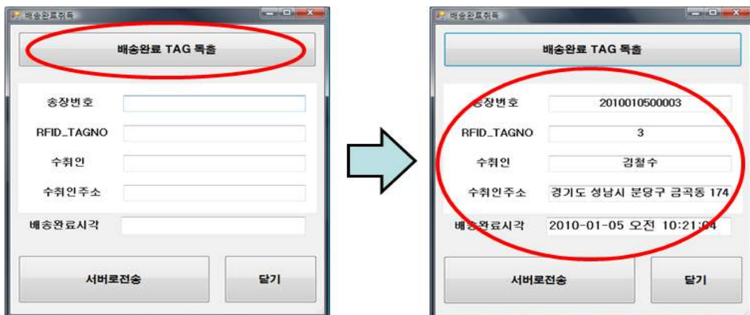
<그림 5> 배송완료정보 취득 확인

배송이 완료되었음을 가정하여 RFID 태그를 회수 후 리더를 통해 ID를 독출하였다. 독출된 ID를 위에서 구축된 개별화물 정보와 매칭시킨 후 현재의 시간을 [DELI_TIME] 컬럼에 삽입하였다. <그림 5>는 ID가 "3"인 태그를 독출하였을 때의 결과를 나타낸 것으로, 위에서 구축된 데이터베이스에서 송장번호와 수취인 정보 등을 정상적으로 매칭시키고 완료시각이 정상적으로 삽입되었음을 보여준다.