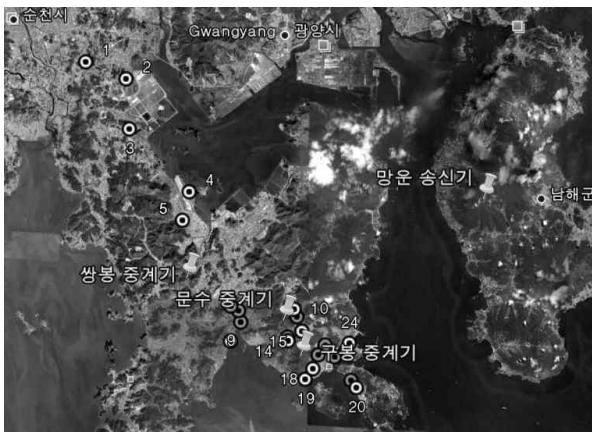
그림 2. 송/중계기의 위치 및 측정 지점