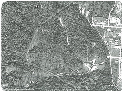
Fig. 1. 연구지역 및 물리검층공의 위치

연구지역에서의 물리검층은 지하처분연구시설(KURT)을 내의 시추공을 포함하여 총 4개의 시추공에서 수행하였으며 각 시추공의 위치와 제원은 그림1, 표1과 같다.