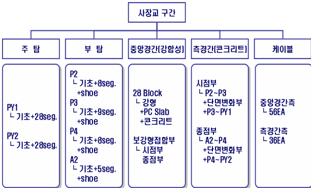
그림 3. 구조물 객체 분할 정보

사범위 중 접속도로, 접속교, 옹벽공을 제외한 사장교 구간만을 모델링 하였으며 객체 분할 정보는 그림 3과 같다.