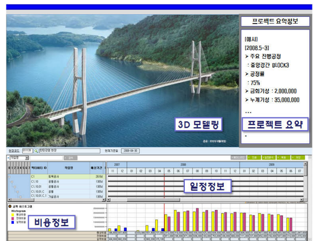
그림 2. 프로젝트 통합관리 구성화면 예시

그림2는 이러한 프로토타입 구축을 통한 결과화면을 가상으로 구성해 본 것이다. 3D 모델링을 통한 3차원 시각화와 함께 액티비티 별 일정정보, 공사비 월별 배분을 통한 월별 비용정보, 전체적인 프로젝트 요약 정보를 한 눈에 살펴볼 수 있도록 구성되어 있다.