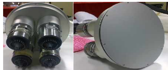
Fig.1 대면적 composite 스틸벤의 housing

대면적 composite 스틸벤을 검출기로 제작하기 위하여 Fig.1과 같이 알루미늄 housing을 사용하였으며, 총 4개의 PMT를 사용하여 광손실을 최소화 하도록 하였다.