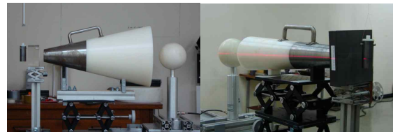
그림 1. AmBe 선원을 이용한 중성자차폐 성능평가장치, AmBe 선원캡슐, 5" 보너감속구 및 LiI(Eu) 섬광검출기, (좌)Large, (우)small Shadow-cone.

에 저장되어 있다가 측정 시 조사지점에 위치할 수 있도록 하였다. 선원과 검출기까지의 거리는 80 cm로 고정하였고 그 선원과 3 cm 거리에 차폐재를 위치시켰다. 그 다음에 Shadow cone을 놓았는데 다양한 차폐재의 크기에 대비하여 2종류를 사용하였다. Shadow cone의 길이는 30 cm의 P.E 부분을 포함하여 총 50 cm이며 직경은 각각 13.5 cm, 29 cm이다.