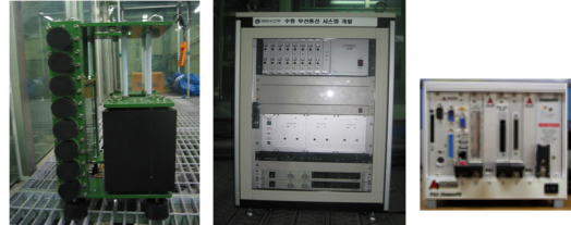
그림 2. 제작된 수중음향통신 시스템

상에서 구현하는 All Digital 수중음향 데이터 통신 시스템을 제작하였다. 2007년 11월 거제도 근해에서 구현된 시스템에 대한 성능시험을 하였으며, 수심 15m에서 9.7km의 거리에서 10kbps의 전송속도로 수중통신 시험에 성공하였다.