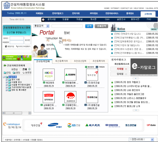
[그림 7] 건설자재 정보 시스템 메인 포털 화면

국내 건설자재의 정보 검색 및 관리를 위한 건설자재 정보관리 시스템[그림 7]을 구축하였다. 이 시스템은 자재의 기본 및 상세정보와 해당 자재의 생산업체정보, 분류체계 뿐만 아니라 전자카탈로그의 자동구현, RFID 적용 자재의 정보 제공, 전자거래 지원등의 기존 시스템과의 차별화된 다양한 서비스 제공이 가능하다. 또한, 시스템 사용자들은 키워드 및 관련어, 카테고리, 분류체계, 업체명, 자재명등의 다양한 검색시스템을 이용하여 원하는 자재정보를 손쉽게 제공 받을 수 있다.