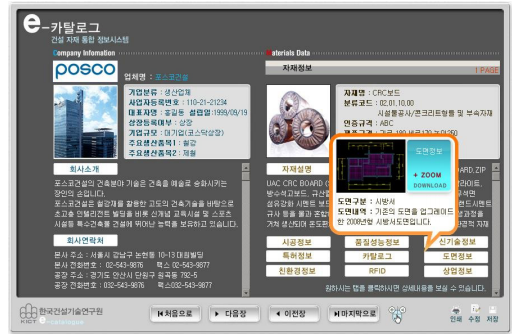
[그림 9] 생성된 건설자재 전자카탈로그

[그림 8]과 같이 건설자재 전자카탈로그는 WAS 서버에서 제공하는 카탈로그 생성모듈을 이용하여 해당 자재정보를 데이터베이스에 호출하고 호출된 정보의 분류체계를 검색하여 카탈로그 라이브러리에서 해당 카탈로그 템플릿을 호출하여 건설자재 e-catalog[그림 9]를 생성한다.