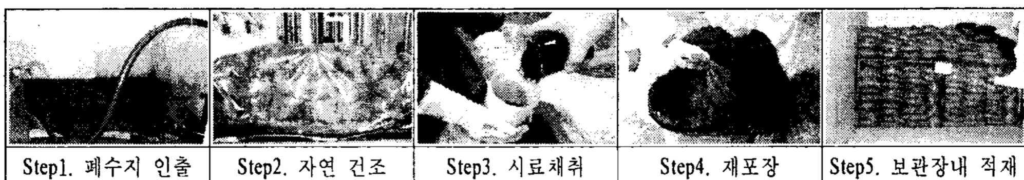
그림1. 폐수지 처리공정(개선 전)

기존의 2차계통 증기발생기(Steam Generator) 취출수 정화 후 발생하는 유기질 이온교환수지는 인출구에 예상되는 발생분의 포장 마대를 사전 준비하여 주기적으로 마대를 번갈아 교환하면서 슬러리 상태로 직접 주입되고 폐수지 인출 작업장 주변 지정장소에서 일정기간 보관 자연건조(약 3~4개월) 및 대표시료 채취, 핵종분석 등의 과정을 거쳐 핵종 불검출 또는 제한치 미만 시 다시 비닐로 밀봉 후 마대에 재포장 하여 처분제한치 미만 방사성 폐기물 보관장으로 이동한다. 그러나 이러한 수지 인출 작업 과정에서 일부 파쇄된 폐수지 입자(크기 : 0.4~1.0mm)가 포장지 외부로 누출될 가능성이 있으며 수지입자 내부의 수분이 건조되면 입자가 수축하여 이동 및 재포장 작업 시 폐수지가 포장 마대를 통과하여 외부로 흘러나오는 경우가 있고 새로운 마대에 포장전 1차로 비닐봉지로 밀봉한 뒤 다음 단계로 마대에 2중으로 포장하는 번거로움이 있다. 또한, 포장지의 재질이 가연성이라 보관 시 제한이 따름은 물론이고 2차폐수지 전용건조장의 부재로 인해 부주의한 취급 시 2차적 오염에 노출될 가능성이 있으며 자연건조 기간이 장시간 소요되어 건조작업장 확보가 어렵고 추출, 건조, 포장 시 작업인력 증원 및 폐수지 재포장 작업 등으로 인해 불필요한 방사성폐기물이 추가로 발생하는 등의 여러 가지 단점이 있다. 그래서 기존의 처리공정(그림1. 참조)보다 안정된 공간에 폐수지를 수용하여 건조 및 추출 등의 처리과정을 일관성 있게 관리할 수 있는 2차폐수지 전용 건조함이 요구 되었다. 이러한 증기발생기 2차폐수지 처리공정 절차를 더욱 개선하여 작업의 효율 제고는 물론 폐수지 인출 및 건조작업 시간 단축, 2차 오염확산 방지 등의 작업환경 개선으로 업무효율 향상 및 방사성폐기물 감용에 기여하고자 한다.