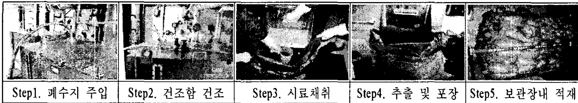
그림2. 폐수지 처리공정(개선 후)

이러한 폐수지 작업공정을 보다 안전성 있게 처리하기 위한 방안으로 2차폐수지 전용건조함을 설치하여 운영 중에 있다. 건조함의 구성은 크게 네 부분으로 발생된 폐수지를 수용할 수 있는 3,000ℓ 용량의 건조함 본체와 건조함 내부로 폐수지 주입 및 건조 완료 시 외부로 추출할 수 있는 주입구와 추출구가 있으며 건조를 위한 공기 주입 노즐부가 있고 건조 및 탈수 과정에서 발생되는 비응축성 가스와 수분배출을 위한 배기부와 배수부 등으로 이루어져 있으며 2차폐수지 전용 건조함 운영 후의 처리공정은 아래 그림2와 같다.