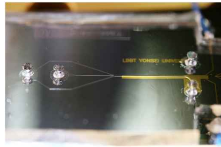
Fig 2. Image of fabricated device.