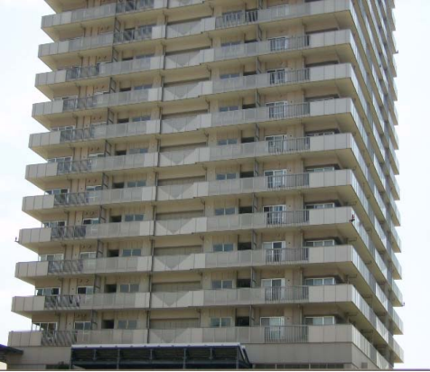
Figure 9. 최근의 고층 아파트 발코니