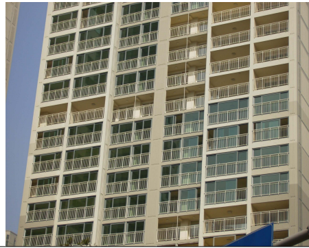
Figure 7. 최근의 고층 아파트 발코니