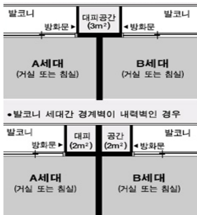
Figure 5. 합법화된 발코니

그러나, 비상계단을 하나 더 만들거나 세대별로 옆집으로 통하는 경량 경계벽 내지 피난구를 설치할 경우 대피공간 확보 의무는 면제된다. 또한, 현 우리의 아파트는 발코니 외