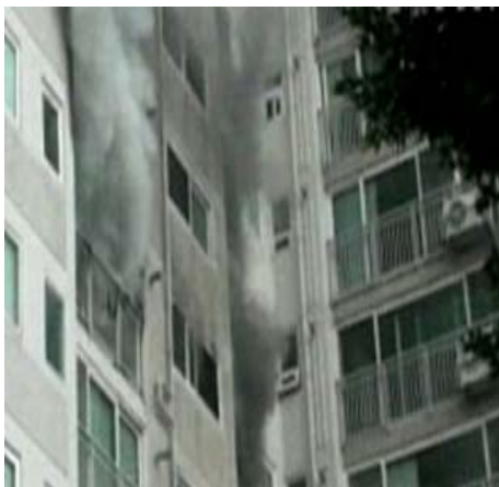
Figure 3. 베란다 측면난간 화재