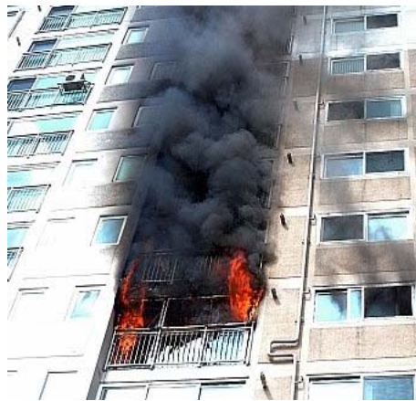
Figure 4. 발코니로부터의 연소 확대