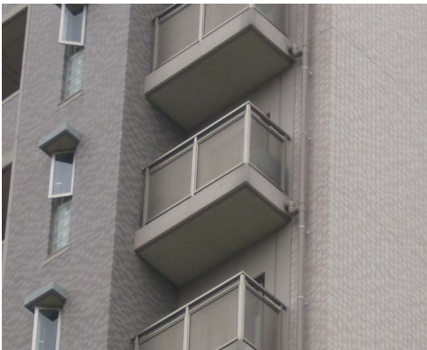
Figure 10. 부속 발코니

일본은 모든 고층 아파트뿐만 아니라 신축 일반 아파트 심지어, 주상복합건물에서도 설치되고 있는 실정에 우리도 법적인 검토가 되어져야한다.