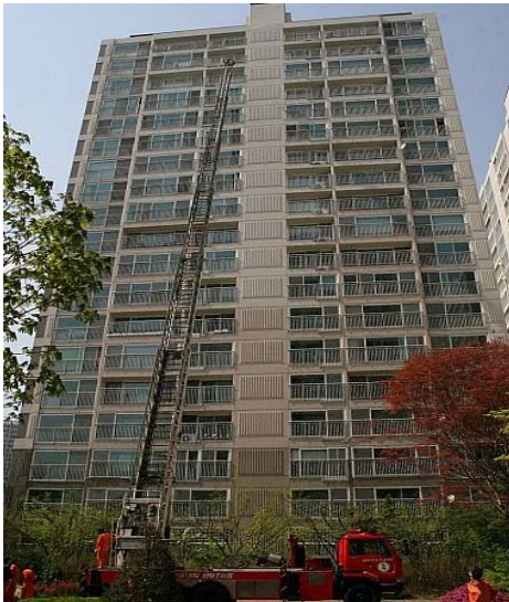
Figure 1. 화재시 사다리차 사용 불가

최근 소방방재청의 고층건물(11층 이상) 화재현황 통계발표에 의하면 2005년에서 2007년의 3년간 화재건수는 4922건에 달한다고 했다. 그중 90%가 주거용이다. 특히, 31층 이상의 초고층 건물에서의 화재는 2005년 25건, 2006년 29건, 2007년에는 32건이 발생 하였다. 무엇보다도 초고층화재시 대응 할 수 있는 고가사다리는 17층 이상에는 대응 할 수 없는것으로서 21층 이상 건물에서는 무용지물이다.(그림1,2)