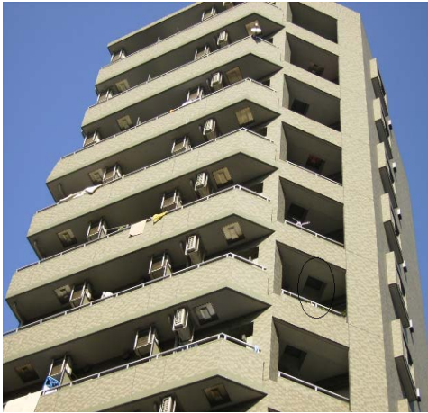
Figure 1. 피난사다리 설치 사례