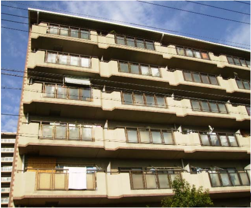
Figure 8. 종전의 아파트 발코니