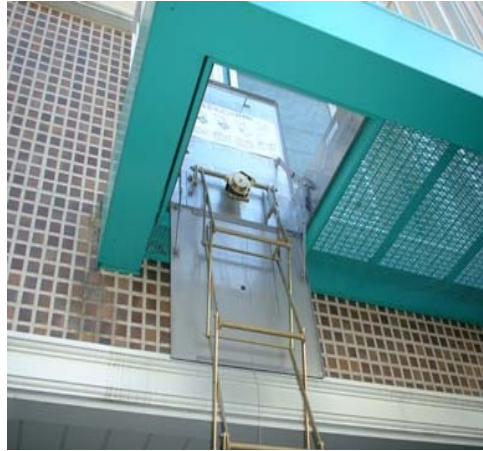
Figure 2. 피난사다리 개방 사례