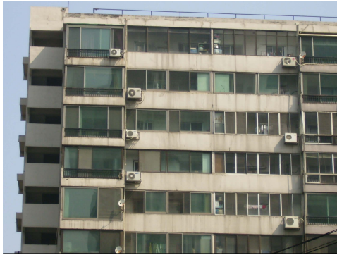
Figure 6. 종전의 아파트 발코니

일부 아파트는 방화문이 아닌 새시문으로 설치돼 화재의 확산 우려가 있고 주민들의 잘못된 인식으로 대피공간에 물건을 쌓아두고 에어컨 싱외기 등을 설치하고 있는 다양한 문제점을 안고 있다.