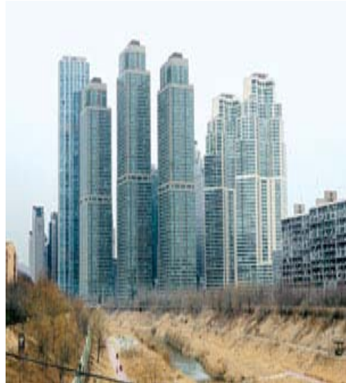
Figure 2. 서울시 초고층 빌딩군