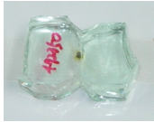
<그림 3> 강화유리 내부 혼입된 NiS로 인해 파손된 켈릿의 나비패턴