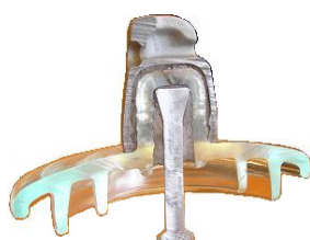
<그림 2> 유리애자 단면