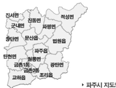
〈그림 2〉 파주시 행정구역

새롭게 건립되었다. 따라서 파주의 다섯 개 도서관 중 3개의 도서관(중앙, 금촌, 교하)은 파주의 서남쪽에 위치하고 있는 세 개의 인접지역인 금촌 1, 2동과 교하읍에 몰려있다. 연면적 6,388㎡ 크기의 중앙도서관이 행정적으로 파주시민 전체를 대상으로 도서관서비스를 제공하고 있다면, 금촌도서관은 금촌 1, 2동과 인접지역을 서비스 대상으로 삼고 있다. 교하도서관은 교하신도시개발로 새롭게 조성된 교하신도시주민과 기존주민을 포함하여 총 77,500명을 서비스 대상으로 삼고 있다. 교하도서관이 교하읍 주민뿐만 아니라 이웃한 조리읍(32,000명)과 탄현면(14,000명)의 일부주민까지도 서비스 대상인구로 삼는다고 하여도 총 서비스 대상 인구는 10만명이 넘지 않을 것이다. 그 근거는 다음과 같다. 서울시와 안양시를 합한 규모의 시면적(672.42km 2 )을 가지고 있는 파주시는 도시가 넓게 퍼져있고, 도농복합도시이기 때문에 지역 간 이동거리가 멀고 이동시간이 많이 소요된다. 따라서 주민들은 멀리 있는 도서관보다는 가까운 도서관을 이용할 가능성이 높다. 따라서 교하읍과 이웃한 조리읍과 탄현면의 대부분의 주민들은 자신들이 거주하고 있는 지역에서 가까운 중앙도서관이나 금촌도서관 혹은 문산도서관을 이용할 가능성이 높다. 실제로 2004년 8월 조사에 의하면 조리읍 주민들은 필요한 도서의 77.9%를 금촌동에 있는 시립중앙도서관을 통하여 대출하고 있다. 22) 또한 파주시 공무원에 의하면 현재의 교하신도시에서 직선거리로 2~3km 거리에 위치하고 있는 교하신도시 운정지구가 2009년에 조성되게 되면 그 곳에 또 하나의 도서관이 건립될 예정이라고 한다. 그렇게 되면 교하도서관의 서비스 대상인구는 신도시 인구의 유입에도 불구하고 현재보다 다소 감소할 것으로 예상된다.