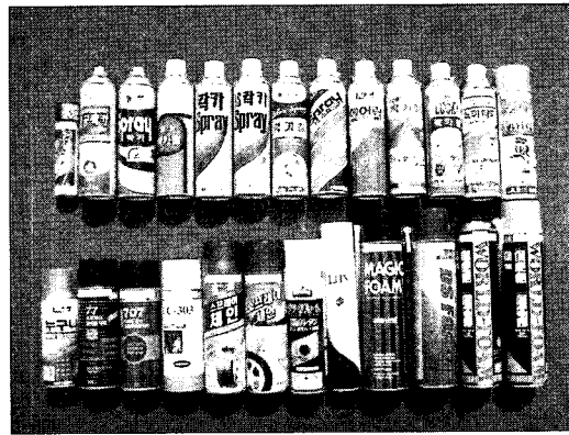
Figure 2 Conventional Aerosol Goods

공업용으로서의 DME는 현재 페인트, 우레탄폼, 문구용품, 화장품 등의 에어로졸 용기에 사용되고 있고, 발전용으로서의 DME는 석탄, 석유 등에 비해 연소 후 공해물질이 적게 발생되어 도시지역 발전에 사용이 가능한 것으로 판단되고 있다. 자동차용으로서의 DME는 세탄가가 높은 특성 때문에 디젤엔진에 사용이 가능하며, 가정용으로서의 DME는 가정용 연료공급시스템의 적용여부와 LP가스 인프라의 변경 없이 LP가스와 혼합하여 사용할 수 있는지에 대한 연구가 추진되고 있다. Figure 2는 DME를 분사제로 사용하는 제품들이다.