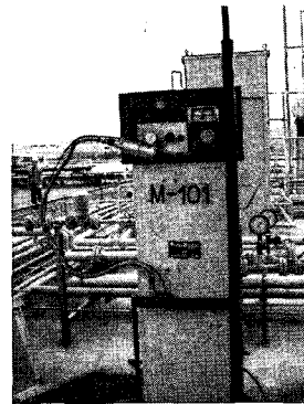
Figure 4 Dispenser for DME