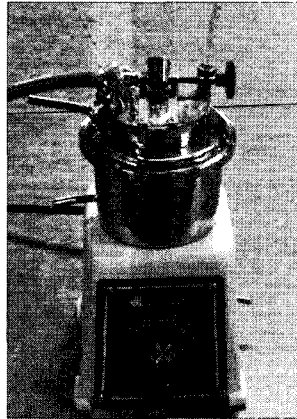
Fig. 1. Photograph of TAG closed cup flash point tester.

장치는 크게 시료컵, 승온 다이얼, 수조, 시험염을 가연성 액체 표면에 가하기 위한 장치 등으로 구성되어 있으며, 부가 장치로서는 시료컵에 시료를 첨가할 때 유량을 조절하도록 하는 유량 게이지(level gauge)가 있다. 또, 수조 상부에는 시험염의 크기를 조정하도록 구 형태의 구조물이 수조에 접합되어 있다.