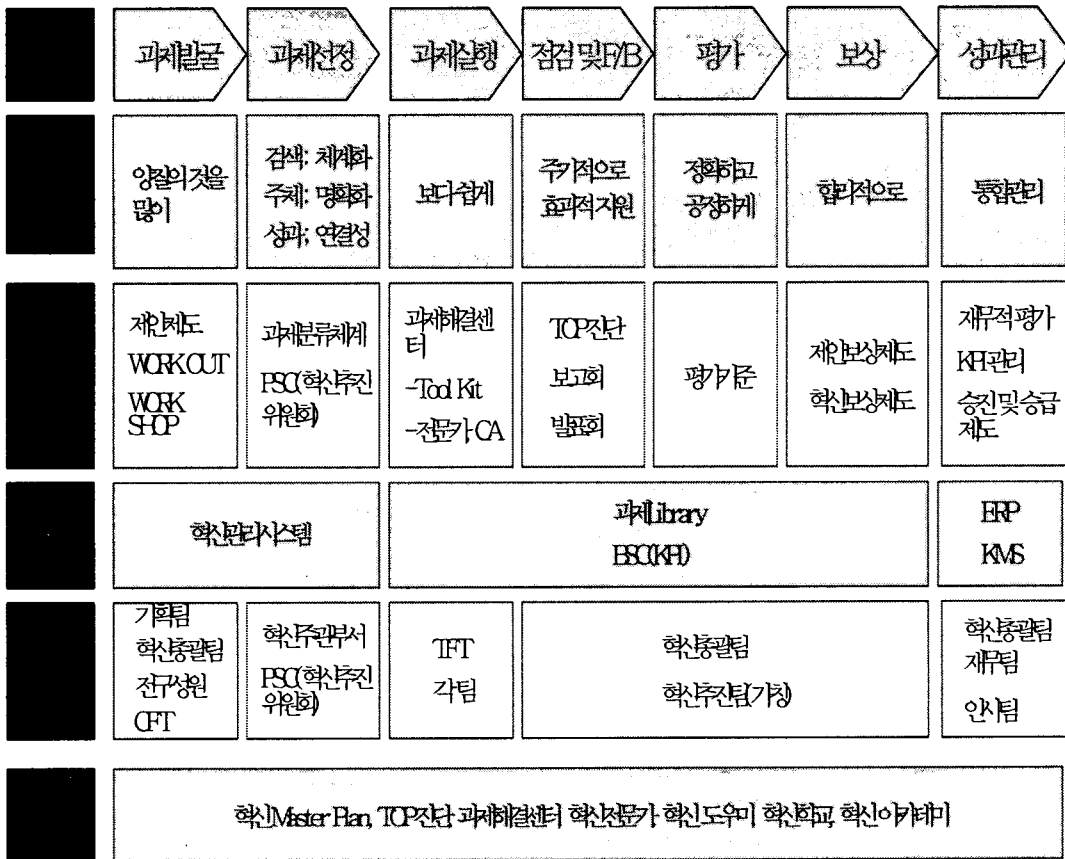
<그림 2> TIM의 관리 Process

또한 ERP와 KMS를 통한 재무적 평가와 KPI관리, 승진 및 승급제도의 효율화와 각 부서 및 팀별 조직 효율화를 도모한다.