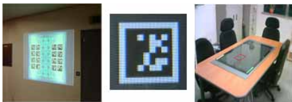
▶▶ 그림 2. AR-Table 환경

본 논문에서는 AR-Table system[16]을 도입하여 새로운 증강현실 보드게임 환경을 제안한다. 그림 2와 같이 빔 프로젝터 또는 PDP 디스플레이에 게임보드와 게임 진행 정보를 표현하여 개인 장치의 연산 부담을 덜어 주었고, 디지털 마커를 활용해 직관적인 객체 증강 및 상호작용이 가능하도록 하였다.