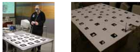
▶▶ 그림 1. 테이블-탑 증강현실 게임 환경

보드게임의 가장 주된 특징은, 여럿이 직접 얼굴을 맞대고 어울리며 즐긴다는 점이다. 그래서 보드게임 환경은 테이블 위의 보드를 중심으로 사용자간 상호작용을 할 수 있는 협업 공간이 제공되어야 한다.