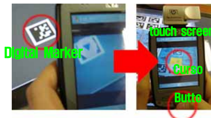
▶▶ 그림 4. 모바일 인터페이스

증강현실 보드게임 플랫폼은 서버 측과 클라이언트 측으로 구분 된다. 서버측은 AR-Table로써 PDP를 활용한 테이블-탑 환경과 프로젝터를 활용한 벽 및 바닥 투영 환경이 있다. AR-Table은 게임 진행의 주체가 되며 게임 진행 정보와 게임보드 및 디지털마커 등을 화면에 나타내어 사용자가 게임 상태를 한눈에 파악할 수 있도록 도와준다. 클라이언트측은 카메라와 무선 LAN카드가 장착된 PDA, UMPC로 구성되며 사용자에게 개인화된 게임 화면과 3차원으로 증강된 게임 화면을 제공하고, AR-Table과 무선 네트워크로 연결되어 게임 오브젝트들을 제어할 수 있도록 해준다. 그림 4는 AR-Table과 개인 장치와의 상호작용 방법을 보여준다.