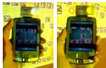
▶▶ 그림 9. PDA 화면