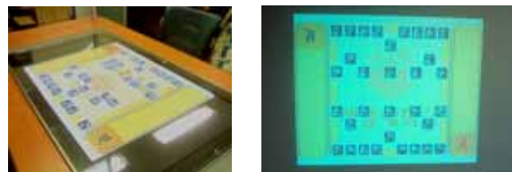
▶▶ 그림 7. AR-Table 화면

려져 있는 보드 게임으로 복잡한 규칙을 가지고 있고 처음 장기 게임을 하기 위해서는 각각의 말 이동에 대하여 숙지를 해야 되기 때문에 초보자가 게임을 즐기까지 시간이 많이 걸린다. AR 장기 게임은 각각의 말 움직임 정보를 개인 장치를 통해 플레이어에게 제공함으로써 초보자도 쉽게 장기 게임을 즐길 수 있게 해준다. 장기 게임은 표현할 게임 요소가 많지 않기 때문에 보드게임 프레임워크의 기본적인 서비스들로 쉽게 구현이 가능하다. 개발 순서는 서버 측인 AR-Table에서 게임 보드와 게임 오브젝트를 대신하게 되는 마커를 오브젝트 매니저를 사용하여 구현한다. 그리고 게임 매니저와 게임 유틸리티 모듈을 사용하여 게임로직을 완성한다. 그림 7은 AR 장기 게임의 AR-Table 화면이다.