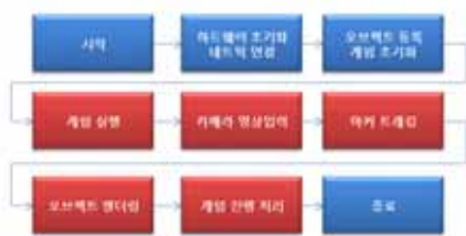
▶▶ 그림 6. 증강현실 보드게임 프레임워크 프로세스

오브젝트 매니저는 게임에서 표현되는 2차원 또는 3차원 오브젝트들을 관리하는 모듈로써 Tracking 모듈에서 생성한 마커 정보와 결합하여 다양한 오브젝트를 증강 할 수 있도록 해준다. 게임 매니저 모듈은 게임로직을 각 단계별로 손쉽게 구현할 수 있는 서비스를 제공한다. 게임 유틸리티는 타이머 및 주사위 등 게임에서 자주 사용되는 서비스를 간단한 함수호출로 사용할 수 있도록 해놓은 모듈이다. UI 및 Interaction 모듈은 앞서 제시한 모바일 인터페이스 서비스를 제공하는 모듈이다. 이와 같은 모듈들은 자주 사용하는 서비스를 미리 정의하고 있기 때문에 신속한 개발을 가능하게하고, 또한 각 모듈간의 연동 구조도 미리 정의되어 때문에 증강현실 기술에 익숙하지 않은 개발자도 프레임워크 구조에 맞춰 실행흐름을 따른다면 큰 어려움 없이 증강현실 보드게임을 구현할 수 있다. 그림 6은 프레임워크의 프로세스 구조를 나타낸다. 빨간색 영역은 자동화된 프로세스영역을 나타낸다.