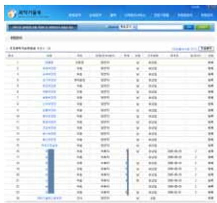
(c) 위원회 위원 관리 화면