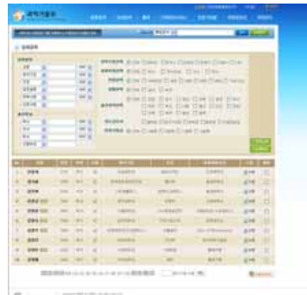
(b) 검색 페이지 화면