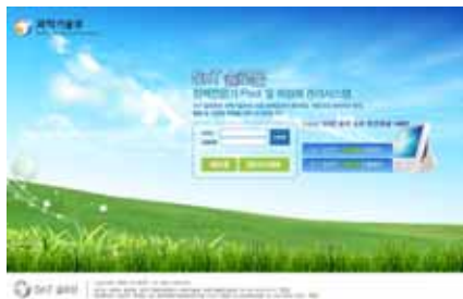
(a) 메인 페이지 화면

그림 2는 구현된 시스템의 동작 화면이다. 그림 2의 (a)는 메인 페이지, (b)는 검색 화면이며 (c)는 위원회 위원 관리 화면이다.