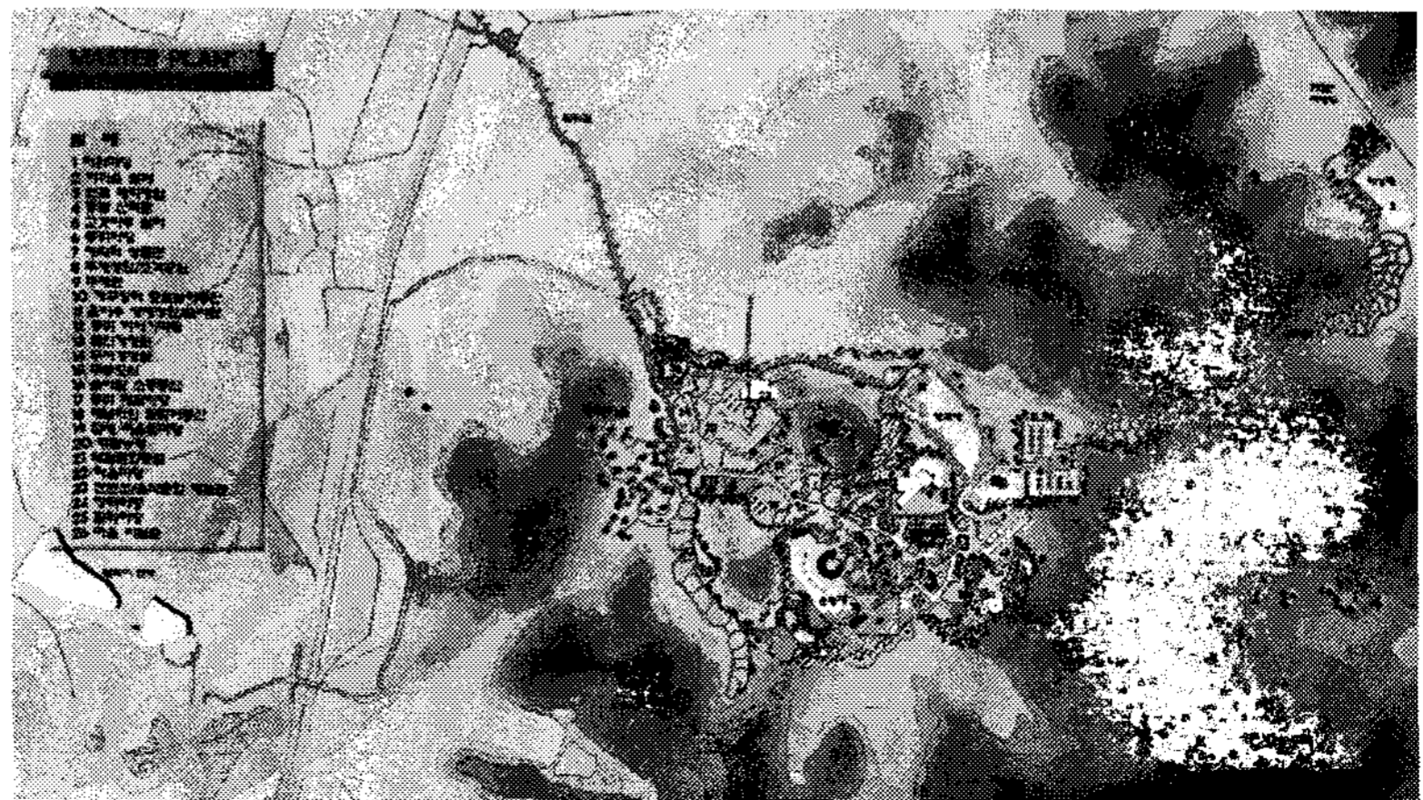
그림 3. Kongju Paljeong-dong Hwamul 기본계획

포장재료와 패턴은 공간적 분위기를 결정해주는 주요소가 되므로 시설공간의 이미지와 주제, 이용계층과 이용압 등을 고려하여 재료와 색상, 패턴과 질감 등을 차별화하여 선택한다. 포장두께 및 표층재료의 선정은 교통하중, 노상조건, 환경 등을 고려하고, 이용압이 높은 포장구간, 차량과 자전거, 보행전용, 보차공존 등을 구분하여 내구성과 유지관리 문제 까지를