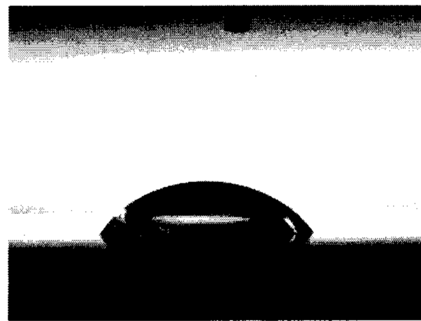
플라즈마 표면 처리 후