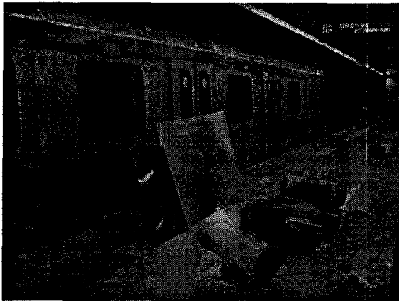
그림 2 연기 발생장치 및 열풍기 설치