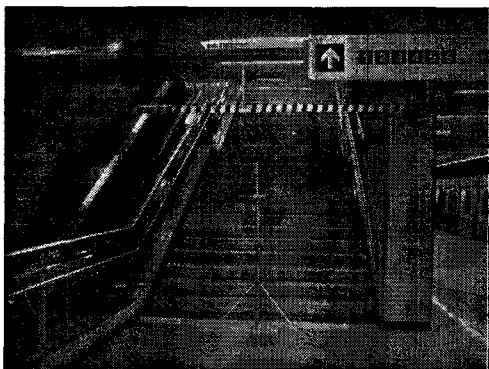
그림 3 내부계단에 설치된 열선유속계