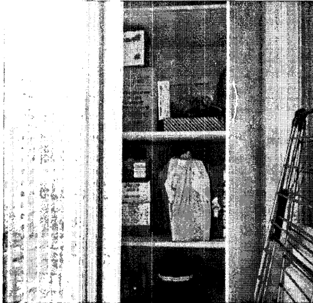
<사진2> 인접세대간 피난이 가능한 시설과 창고용도로 사용되는 상황 (아파트 내에서 화재가 발생하여 현관 출입문을 통해 피난이 어려우면 베란다로 피난하여 경량 합판을 부수고 이웃 세대로 피난할 수 있어야 한다)

이렇게 2방향피난이 가능한 시설이 설치되고 제대로 관리된다면 현관으로 피난하지 못해 사망하거나 부상을 입는 사고를 방지할 수 있을 것이다.