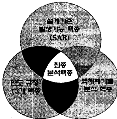
그림 2. 분석대상 핵종 선정방법

현재 폐필터에서 핵종분석용 대표시료를 채취하는 방법 및 절차에 관한 연구가 진행중이며, 이를 토대로 폐필터에서 대표시료를 채취하여 먼저, HPGe를 이용한 감마 핵종분석을 실시한 후, 그 시료를 다시 전처리하는 과정을 거쳐 베타 및 알파 핵종에 대한 분석을 수행할 예정이다. 이 때, 그림 2와 같이 폐필터 발생시설의 설계기준에서 발생 가능한 핵종과 시설별 액체폐기물 핵종 분석 자료 그리고 인도규정에서 요구하는 분석대상 핵종을 모두 만족하는 핵종들에 대하여 베타 및 알파 분석대상 핵종으로 선정할 것이다. 또한, 기타 실험실에서 발생된 폐필터들의 경우에는 해당 실험 기간 동안의 동위원소 사용내역을 파악하여 인도규정에서의 분석대상핵종에 포함되는 지를 조사할 것이다.