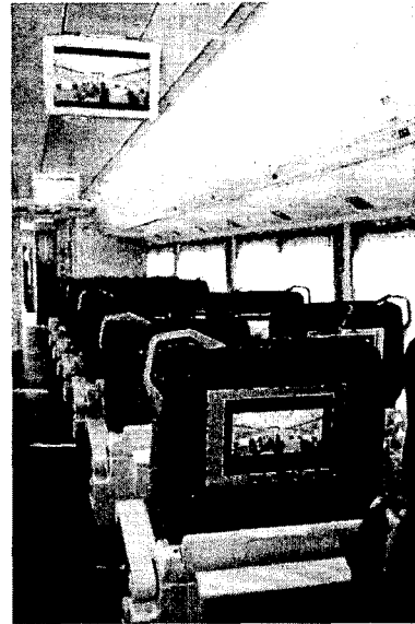
그림 1 틸팅열차 멀티미디어 시스템

동행 위성 안테나는 Th차량의 옥상에 설치되어 있고, RF 증폭기 & RF분배기, 위성 방송 수신기를 멀티미디어 장치 설치부에 설치되어 있습니다. 위성방송 3개 채널 이상을 서비스 하며, 음영지역에 대해서는 GPS신호와 TMS신호를 이용하여 이동거리 및 음영지역을 체크하고, 90% 이상 실시간 전송이 가능한 지역에서 서비스합니다. 그리고 터널, 도시, 협곡등의 음영지역에 대해서는 미리 저장된 동영상 방송을 서비스한다.