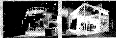
한국홍보관 좌,우에 위치올넷의 언론 기능연기전 및 PDP, 핸드폰전시