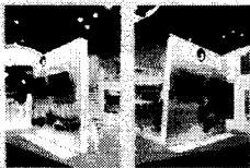
관광, 산업에 관련된 그래픽 및 영상 온온한 한국미를 위해 간접조명 KOREA 씨언 및 측면 설치마감