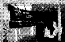
위성파 지상파가 DMB실현 현장에서 휴대폰 및 DMB 단말기모 방송시청