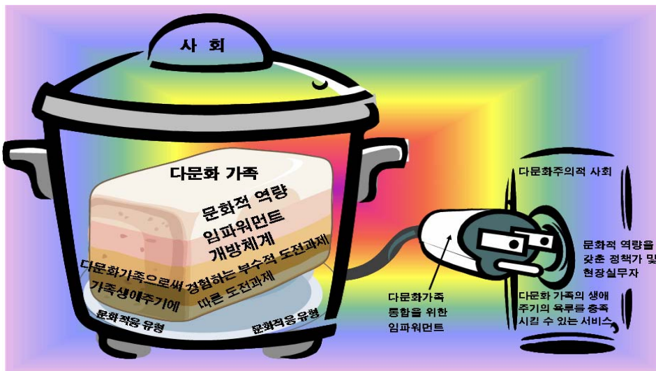
<그림 2> 가족발달주기상 경험하게 되는 도전과제 해결을 위한 지원방안 방향성

<그림 2>는 현재 시점에서 다문화 가족이 처한 상황과 도전과제 그리고 이를 지원하는데 필요한 요소 즉, 다문화주의 사회, 문화적 역량을 지닌 실무자, 다문화 가족을 위한 지원서비스들을 표현한 그림이다. 다문화가족의 문화적응전략에 따라 생애주기상 도전해야 할 과제의 해결방안이 달라지게되는데 이때 앞서 언급한 지원요소들의 적절한 제공은 다문화가족이 무지개떡처럼 가족성원의 각자의 문화적 정체성을 유지하면서도 하나의 가족으로 단합되어질 수 있다.