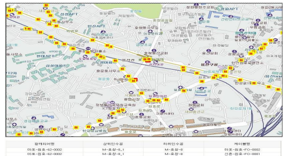
그림 3 동일관로 GIS 위치제공의 예

사용자는 본 시스템에 동일관로 현황분석을 요청할 수 있는데 동일관로 수용여부, 관로유형, 광케이블의 지역구분, 동일관로 수용거리등의 조건에 따라서 검색할 수 있다. 사용자의 요청이 들어오면 동일관로 현황분석 알고리즘으로 DB 에서 관로정보와 회선정보를 연동하여 출력제어부로 데이터를 전송하며 입출력제어부에서는 사용자가 요청한 형식에 따라 사용자에게 동일관로 수용현황 결과를 제공하게 되며 사용자의 요청에 따라 그림 3 과 같이 지도에 해당구간을 표시하여 제공한다.