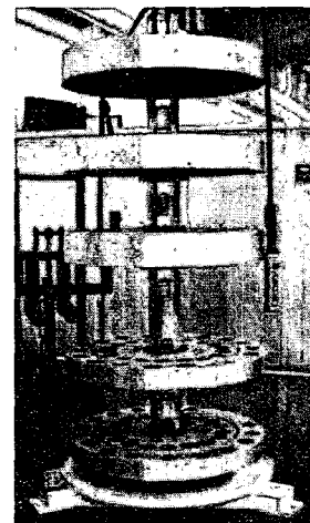
Fig. 3 Tower type automatic tool changer

본 연구에서는 타워식 자동 공구 교환장치를 개발함에 있어 유한요소법에 의한 구조해석을 수행하여 타워식 자동 공구 교환장치의 안전함을 확인하였다. 또한 툴 포트를 수용하는 테이블을 다층으로 형성하고, 하나의 층을 구성하는 테이블에 3중의 툴 포트 수용열을 구비하게 할 수 있어 테이블의 반경을 작게하고도 많은 수량의 공구를 수납할 수 있어 자동 공구 교환장치의 설치면적을 줄일 수 있을 뿐 아니라 꺼내려는 공구가 탑재된 테이블만 회전하게 함으로써 회전하는 테이블에 작용하는 하중이 적어 회전 관성력이 크지 않으므로 적은 동력으로도 고속운전이 가능하고 위치제어가 용이하다. Fig. 3은 제작 중인 타워식 자동 공구 교환장치이다.