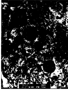
Fig. 1 TEM Micrographs of additional deep cryogenic treated specimen.

또한, 대표적인 냉간단조용 금형강 중의 하나인 SKH51 또한 동일한 양상을 나타내었으며, 강도 분석을 위해 2 가지 소재에 대한 굽힘강도 시험을 수행하였다. 시험 소재는 상대 비교를 위해 일반 열처리된 소재와 함께 비교하였으며, 시험 결과는 표 1 과 같이 2 가지 소재 모두 20%에 달하는 강도 향상 효과를 얻을 수 있음을 확인할 수 있었다.