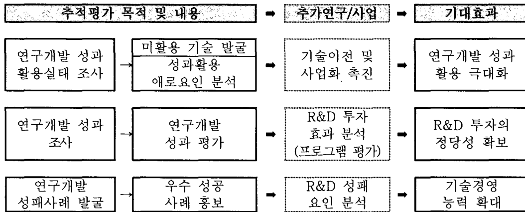
<그림 1> 추적평가의 목적과 기대효과

추적평가는 연구종료 후 일정기간이 경과한 후에 기술이전을 측정하는 단계로, 연구소 내외로의 성과활용 상황을 파악하고, 이를 통해 학계, 산업계에 어떻게 기여(영향, 직접공헌, 파급효과)했는가를 파악하는데 목적이 있다(한국과학기술연구원, 1993). 즉, 추적평가는 연구과제 수행을 통해 도출된 연구결과(output)가 어떻게 활용되어(transfer) 어느 정도의 성과(outcome, impact)를 도출하였는가를 측정하는 것이다.