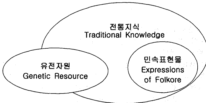
그림 1. 전통지식과 유전자원 및 민속표현물의 영역

위에서 언급한 전통지식의 광의의 개념에는 전통적 지식체계와 형태적으로 유형체인 유전자원(Genetic Resource), 그리고 유·무형체가 포함되는 민속표현물/민간전승표현물(Expressions of Folklore)을 포함한다. 유전자원은 오랜 세월 유전자원에 축적된 유전적 기능에 포함되어 있는 지식을 의미하며, 민속표현물은 표현물 자체에 보유하고 있는 지식체계를 의미한다. 즉, 유전자원과 민속표현물은 그 속에 전통적 지식체계를 포함하고 있는 유·무형체로서 전통지식의 소집합으로서 한 부분을 차지하고 있다. WIPO는 전통지식 중 국제지식재산권 요소가 많은 유형체인 유전자원과 유·무형체인 민속표현물을 지재권에 포함시켜 때로는 통합적으로 때로는 개별적으로 논의하고 있다. 유전자원과 민속표현물 이외에도 전통지식이 충분히 내재되어 있는 향토자원과 같은 대상물이라면 전통지식의 범주에 포함시킬 수 있을 것이다. 전통적 지식체계를 함유하고 있는 유·무형체 자체도 편의상 광의의 전통지식이라 한다. 이들 전통지식은 서로 겹쳐있거나 단독으로 지식체계를 형성하고 있다. 예를 들면 우리나라에서 한약으로 사용되고 있는 십전대보탕에 사용되는 약초는 유전자원이고 약초의 종류, 첨가비율, 약효 등 제법은 전통지식이라고 볼 수 있다. 우리나라의 국보1호인 승례문은 우리의 역사적 창조물로서 전통지식이라고 볼 수 있다. 승례문의 전통지식 요소는 승례문 자체가 아니라 그 창조물에 내재해있는 고유한 건축 기법과 단청의 비법 등의 지식체계를 의미하지만 편의상 승례문을 전통지식의 대상물(전통지식 자원)로 칭한다.