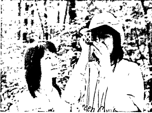
[그림 5] 숲 보호