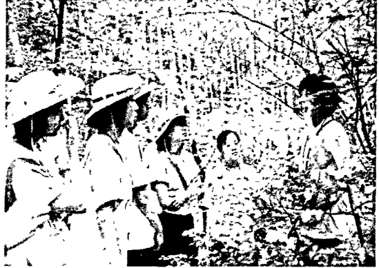
[그림 6] 숲과 나무