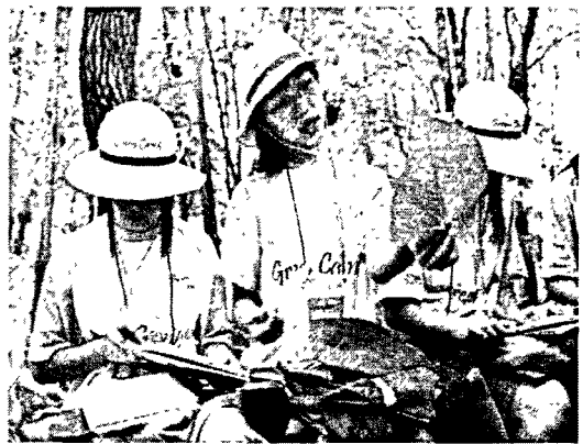
[그림 4] 숲과 생물다양성