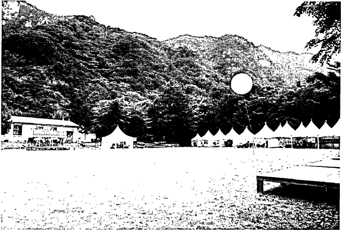
[그림 2] 그린캠프 전경