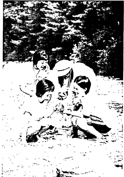
[그림 8] 숲과 물