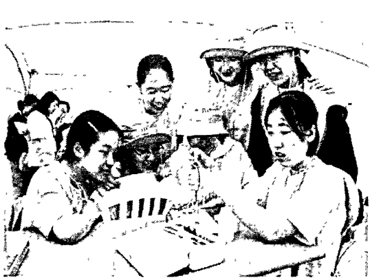
[그림 3] 숲과 대기