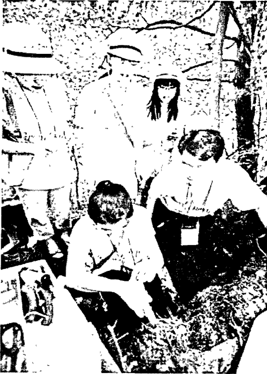
[그림 7] 숲과 토양