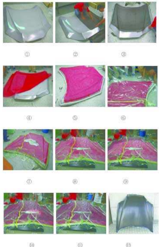
Fig. 4 VaRTM process for engine hood