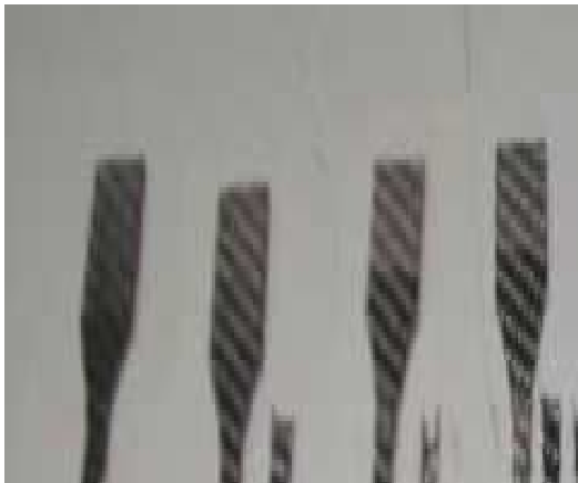
Fig. 1 Fractured specimens of hand lay-up

수지 함침율을 측정한 결과 hand lay-up 시편이 약 50%의 함침율을 보이는 반면 VaRTM 시편은 약 36%로 낮은 값을 나타내었다. 100배 현미경사진을 통하