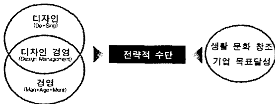
<그림 2> 디자인 경영의 기본 구조도

디자인 경영이란 디자인과 경영의 복합어로 주어진 시간과 예산 속에서 디자인 서비스의 질적 수준을 높이고 생산성을 극대화시키기 위해 디자인 조직을 보다 합리적으로 운영하고 디자인 행위를 보다 과학적이며 체계적으로 수행케 하는 것이다. 그것은 디자이너들의 권익 옹호, 독창적인 디자인 아이디어의 창출과 발전, 그리고 합리적인 디자인 평가기준에 의한 좋은 디자인의 창조를 궁극적 목적으로 한다. 3)