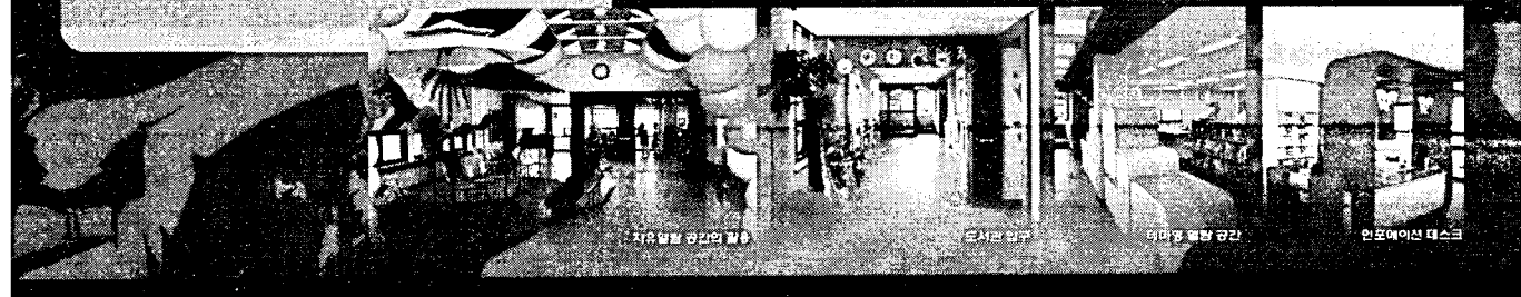
자유일본 공간의 일부