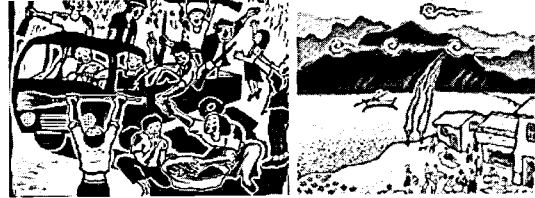
좌: 홍성담 '대동세상' 광주의 진실과 새 세상의 전망을 형상화 우: 신경림의 '목계장터'

있었다. 민중문학, 민중예술, 민중가요, 노동운동 등 사회문화계 모든 분야에서 활발한 민주화 요구가 거세지던 시기였지만, 유독 디자인계는 선진국 신드롬을 추종하며 사회현실을 외면하였고, 정부정책과 그 움직임을 같이 하며, 미국식 모던 디자인을 소개하는 것으로써 그 조국 근대화에 일조하고 있다는 믿음을 가졌었고, 한국사회에서는 이슈화되지도 않은 "실버, 그린, 유니버설, 전통문화" 등과 같은 키워드 들을 화두로 내세우고 있었고 4) , 80년대 말에는 진흥원 주도의 포스트 모더니즘, 해체주의스타일 등을 흉내내는 경향도 나타났다.