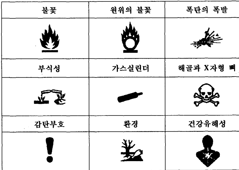
표 1. GHS에 사용되는 심벌 표시

GHS와 국제연합 위험물수송권고·모델 규칙 14) (이하 「모델규칙」 이라고 한다)와의 관계에 대해서는 다음과 같이 규정되어 있다. 운송에 대해서는 모델규칙으로 지정된 그림 문자를 라벨에 사용하는 경우에는 같은 위험유해성에 관한 GHS의 그림문자를 사용해야 하는 것은 아니다. 또 UN의 모델규칙에서는 경고문구와 위험유해성정보를 기재하지 않고 주로 그림문자 형식으로 표시정보를 제시하는 것이 인정되고 있다.