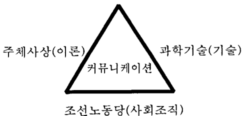
[그림 2] 북한의 문화

북한의 사회주의 헌법 제8조를 보면 “국가는 착취와 압박에서 해방되어 국가와 사회의 주인으로 된 로동자, 농민, 근로인테리와 모든 근로인민의 이익을 옹호하며 보장 한다”고 밝힘으로 로동자, 농민, 근로인테리와 모든 근로인민의 중심의 사회임을 보여주고 있다. 이러한 사회를 유지하기 위해 북한문화를 이루고 있는 요소들을 살펴보자. 북한사회의 학문, 신념, 이론은 주체사상이라고 할 수 있다. 주체사상은 수령의 올바른 지도로 “사람은 자주성 창조성의식성을 가진 사회적 존재로서 사람이 모든 것을 결정 한다”는 기본적인 이념을 바탕으로 수령, 당, 대중을 하나의 운명공동체라는 점을 강조한 ‘사회정치적 생명체론’을 말한다. 이러한 북한의 사회이념에 실체를 부여하고 추진하는 사회조직은 조선노동당으로 근로대중의 모든 조직들 가운데서 가장 높은 형태의 혁명조직으로 규정하고 있다. 이러한 이념과 사회조직을 진행하는데 필수적인 도구 및 물리적 설비를 나타내는 북한의 최근 과학기술 수준은 열악한 기술 자본으로 IT산업 육성이 어려운 실정이며 먼저 인재양성 및 IT마인드 조성에 치중하고 있다고 한다.