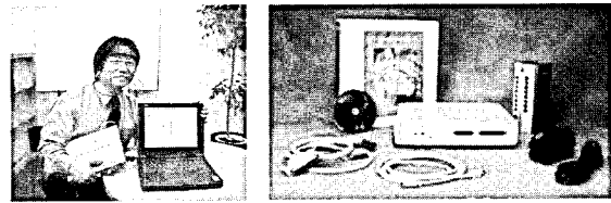
[그림 3] HSK 중추리듬모니터시스템(좌)과 BIOPAC MP100 시스템(우)

따라서 본 실험에서도 제품을 사용하면서 나타나는 사용자의 뇌파를 측정하여 task 수행 중의 감성 변화를 측정하고자 한다. 뇌파는 히로시마국제대학의 요시다 린행(吉田 倫幸) 교수가 개발한 HSK 중추 리듬 모니터 시스템을 이용하여 측정한다. HSK 시스템은 좌우 전두부(Fp1, Fp2)의 뇌파를 기록해 실시간으로 뇌파의 주파수의 변화를 파악하여 그 특징으로부터 뇌의 활성화 및 쾌적도를 정량 평가하는 시스템이다(그림 3). 또한 심전도, 피부전기활동(electrodermal activity; EDA 또는 galvanic skin response; GSR), 근전도(electromyogram; EMG), 혈압, 맥박, 손가락용 적맥파(FPG), 눈깜빡임(eyeblinking) 등과 같은 다양한 생리신호도 함께 측정하여 각각의 결과를 비교, 검토함으로써 사용자의 감성 변화에 대한 보다 정확한 데이터를 측정할 수 있을 것이다. 이러한 생리신호는 Biopac Systems Inc.에서 제작한 BIOPAC MP 100 시스템을 사용하여 측정한다. 이 시스템은 각종 생체신호 및 각 기존 계측장비에서 나오는 신호를 최대 16채널 실시간 동시 기록할 수 있는 장비이다(그림 3).