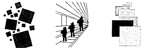
[그림 2-2] 깊이감, 공간감에 의한 지각요인

이와 같이 우리 눈을 통한 지각 원리는 주어진 환경과 조건에 따라 다르게 받아들여지기 때문에 면이라 할지라도 커다란 공간상에서는 상대적으로 점으로 보이기도 하며 또 폭에 대한 길이의 비례가 어느 정도인가에 따라 선이 되기도 하며 면이 되기도 한다. 이러한 다양한 표현들에 의해 입체적으로 지각되고 있다.