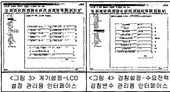
<그림 3> 계기설정-LCD 설정 관리용 인터페이스

계기설정 기능관리 인터페이스는 현재 선택된 검침 전용 프로그램의 계기설정을 관리하는 GUI이다. 계기설정 기능은 기기설정과 LCD 설정, LCD 출력 설정, 모뎀설정으로 구성되어 있다. 그러므로, 계기설정 기능관리 인터페이스는 네 가지 설정을 관리하는 인터페이스를 제공한다. 그림 3은 계기설정 기능 중에서 LCD 설정 관리용 인터페이스 실행화면이다.