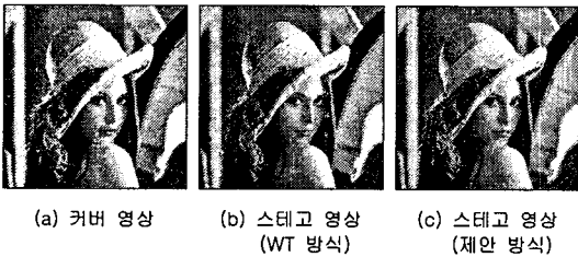
그림4. 실험 영상(lena image, 6-level)

앞에서 기술한 WT 방식과 제안 방식에 대하여 각각 실험한 결과를 보인다. 실험 영상은 모두 256 그레이 영상이며, 크기는 256×256, 양자화 범위 분할 레벨은 6(8, 8, 16, 32, 64, 128) 및 레벨 13(2, 2, 4, 4, 4, 8, 8, 16, 16, 32, 32, 64, 64)으로 나누어 각각 실험한 결과를 그림 4와 그림 5에 나타내었다.