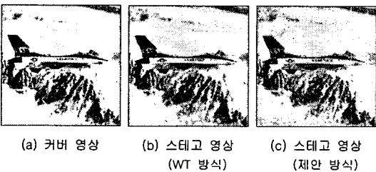
그림5. 실험 영상(airplane image, 13-level)

또한, 표1은 WT 방식과 제안 방식의 실험 결과에 대해서 수치적인 비교를 수행한 것이다.