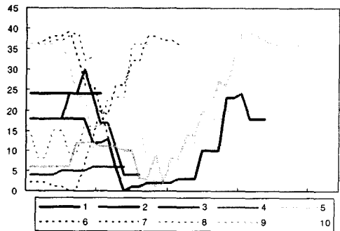
그림 3. 위치 이동에 따른 최정합 노드의 변화

향후 연구로는 체계적으로 좀 더 많은 데이터를 수집하여 예측 정확도, 예측에 걸리는 시간 등의 관점에서 제안한 방법의 유용성을 검증해볼 것이다. 또한 RSOM의 클러스터링 성능을 높이기 위한 GPS 데이터의 적절한 전처리에 대한 연구가 이루어져야 할 것이다.