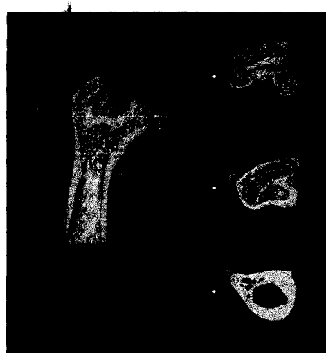
Fig.2 Cross section images of mouse femur