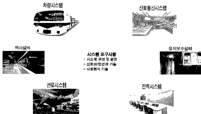
<그림 1> 도시철도 시스템의 구조

전력시스템이란 차량의 운행에 필요한 전력을 공급하기 위한 설비로서 고속도차단기, SCADA 등을 말한다. 신호·통신시스템이란 열차를 자동 또는 무인으로 운전하기 위하여 필요한 차상 또는 지상에 설치된 설비 및 데이터 송·수신시스템으로서 자동열차제어장치(ATC), 자동열차운전장치(ATO) 및 자동열차관리장치(ATS) 등을 말한다. 선로시스템이란 도시철도차량이 운행될 수 있도록 차량을 지지하고 안내하기 위한 구조물로서 궤도, 상·하부교각 등을 말한다. 역사설비란 승객들이 승·하차에 필요한 승객안내장치, 방송장치, 승강장스크린 도어 등을 말한다. 유지보수설비란 차량의 정비를 위하여 필요한 설비들을 말한다. 운영시스템이란 시철을 이용하여 차량을 운행하기 위해 필요한 인적 및 관리체계를 말한다.