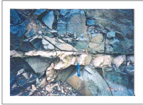
6) 만남재에서 삼인산 방향으로 약 400m 부근의 소방도로변 절단면