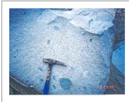
5) 만남재에서 삼인산 방향으로 약 350m 부근의 소방도로변 절단면