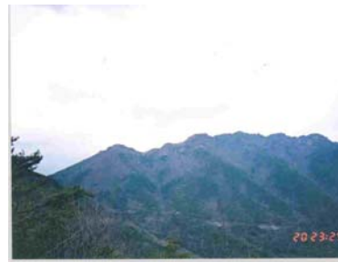
Fig. 1. Mt. Byung-pung

또한, 담양 병풍산은 주변에 국제 청소년 수련원이 있어 매년 약 10만 명의 청소년들이 심신의 단련을 위해 찾는 곳이여서 이들에게 기시설된 천문대, 자연사 박물관, 암석원 등과 함께 살아있는 지구과학 테마 학습장을 제공함으