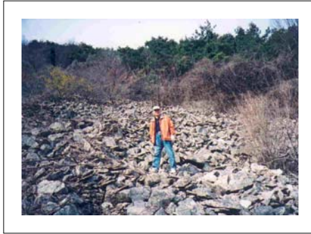
3) 만남재 근처의 소방도로변 절단면