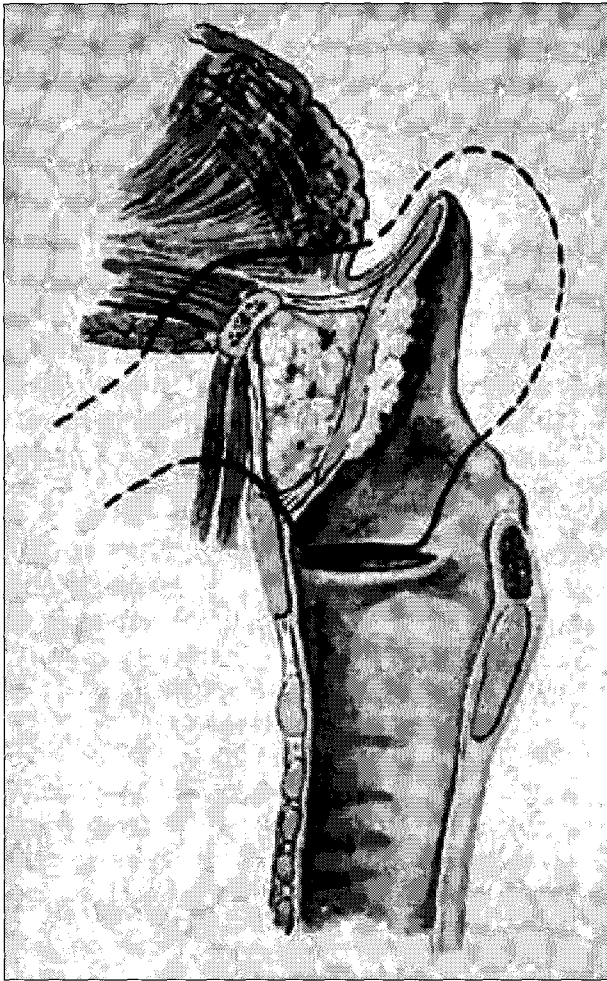
Fig. 1. SGL.

가적으로 피열연골을 절제하거나, 윤상연골의 상부를 부분적으로 절제하는 술식이다.