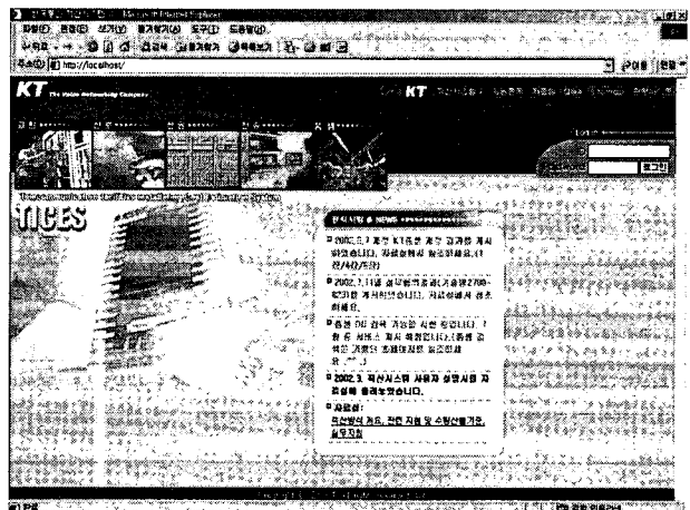
그림3. 적산시스템(TICES) 초기화면

KT에서 전환을 추진중인 실적공사비에 의한 적산방식과 새로운 목표가격 산정방식들은 이제 도입 초기이다. 따라서 많은 어려움도 있고 적용 상 오류도 발생할 수 있으나, 원가절감과 통신품질 향상을 위해서는 다양한 적산방식의 도입을 통해 비효율적인 면들을 배격하고 통신품질 향상을 위한 초석을 이루어야할 것이며 KT와 관련 업계간에 긴밀한 협업이 이루어져야할 것이다.