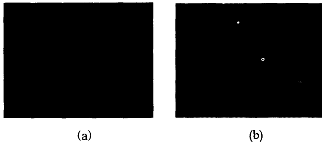
Fig.2. Microscopic images of bitumen/SBS blends at 160°C. (a)97/3; (b)90/10.