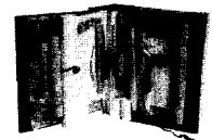
<오래되고 좋은 책> 수진 로로, 1998